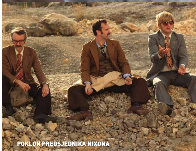
POKLON PREDSDJEDNIKA NIXONA