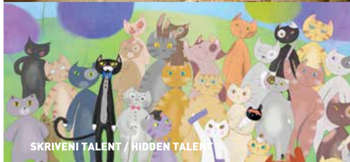
SKRIVENI TALENT / HIDDEN TALENT