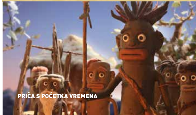
PRIČA S POČETKA VREMENA

Na početku vremena u selu nalik afričkom gdje je narod vjerovao u raznovrsna čudesa, plemenski vrač uznemiren vizijom dolaska mitskog čudovišta odabire mladog ratnika koji mora otići na kraj svijeta i pronaći Bijelu djevojku, jedinu koja mu može pomoći svladati demona i pobijediti vječnu tamu. Put je neizvjestan, vremena je malo, a seoski vrač je blagoljubliv. Film Priča s početka vremena prikazan je na više od dvadeset festivala u Hrvatskoj i svijetu.