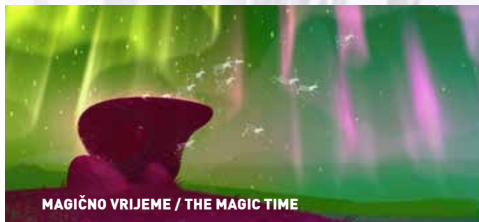
MAGIČNO VRIJEME / THE MAGIC TIME