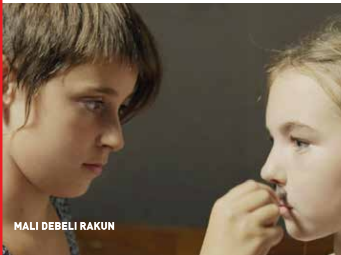
MALI DEBELI RAKUN

REŽIJA: Zlatko Grgić PRODUKCIJA: Zagreb film Animirani | 1968. | 10'