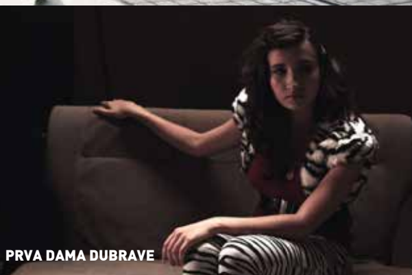
PRVA DAMA DUBRAVE