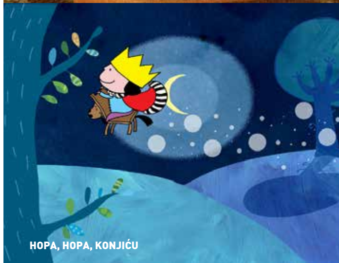
HOPA, HOPA, KONJIČU