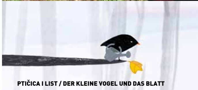
PTIČICA I LIST / DER KLEINE VOGEL UND DAS BLATT