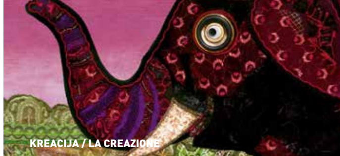
KREACIJA / LA CREAZIONE

Gospodin ljudsko tane posljednjih je dana vrlo čudljiv, što uznemiruje njegove kolege iz cirkusa. Njegove nepodopštine uvijek loše završe, a izljev bijesa samo ga još više potpale. Ne bi li bilo lakše jednostavno se svemu smijati?