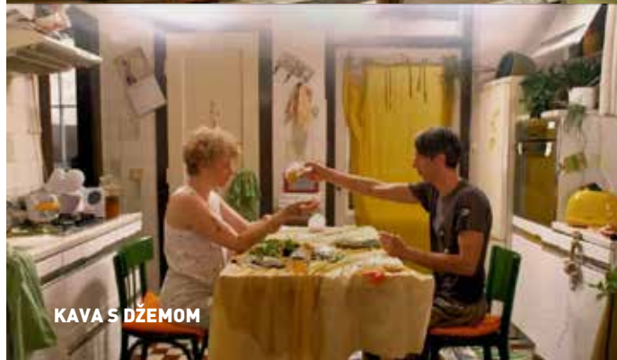
KAVA S DŽEMOM