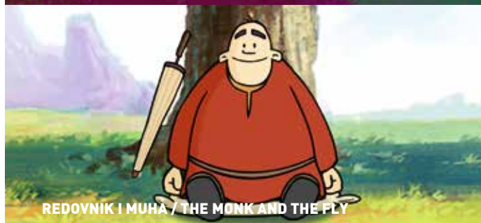
REDOVNIK I MUHA / THE MONK AND THE FLY