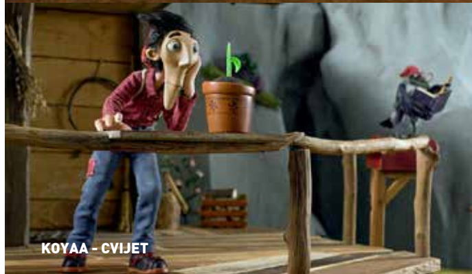
KOYAA – CVIJET