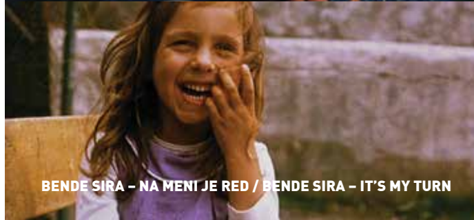
BENDE SIRA – NA MENI JE RED / BENDE SIRA – IT'S MY TURN