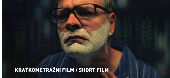
KRATKOMETRAŽNI FILM / SHORT FILM